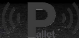
GOPAL® SENSORE PER PALLET