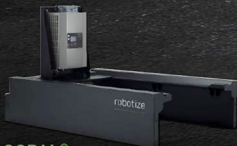
GOPAL® STAZIONE DI RICARICA