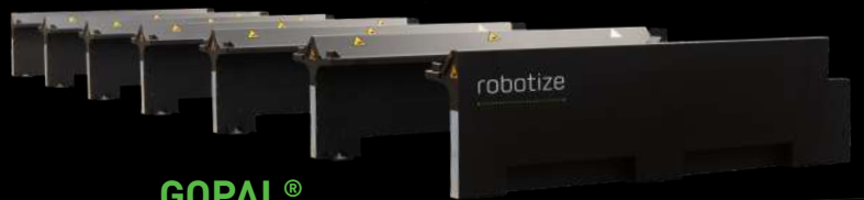
GOPAL® ESPANSIONE PER STAZIONE PALLET