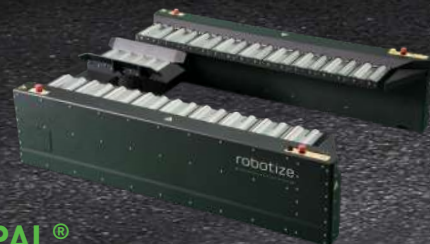
GOPAL® STAZIONE CON NASTRO TRASPORTATORE (EW)