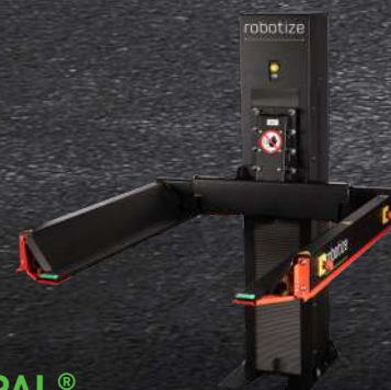
GOPAL® STAZIONE DI SOLLEVAMENTO