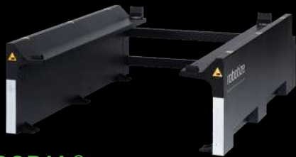
GOPAL® STAZIONE PALLET

Tutte le stazioni GoPal per pallet sono in grado di collaborare con le persone. Le soluzioni GoPal definiscono nuovi standard di sicurezza nell'automazione del trasporto interno di pallet, superando l'idea che i robot siano poco sicuri o difficili da gestire.