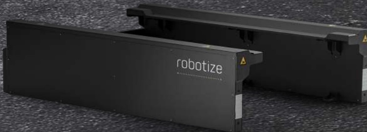
GOPAL® STAZIONI PALLET