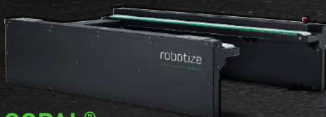
GOPAL® STAZIONE CON NASTRO TRASPORTATORE (E)