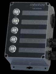
GOPAL® PULSANTE DI CHIAMATA (X5)