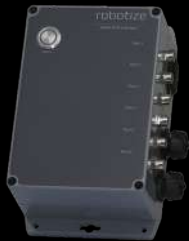
GOPAL® CONNETTORE AUX PER LA GESTIONE DI SEGNALI I/O

Per facilitare ulteriormente l'automazione semplice e sicura del trasporto di pallet, tutti i nostri accessori sono progettati, prodotti e approvati per integrarsi perfettamente con i nostri AMR e il nostro software GoControl. GoPal è una soluzione plug-and-play completamente integrata, sicura e semplice, senza sorprese o costi nascosti.