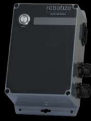
GOPAL® PULSANTE DI CHIAMATA (X1)