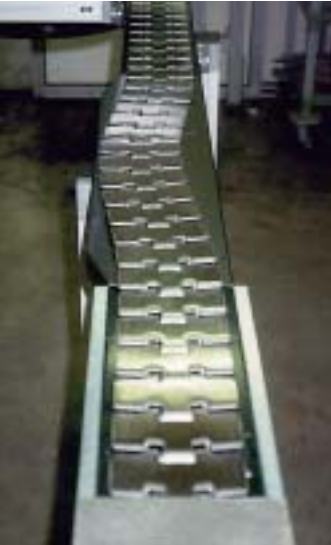
Segmento di trasferimento con catena in acciaio