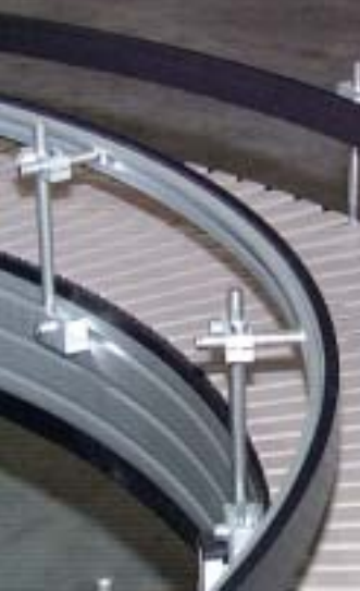
Curva con guide laterali regolabili