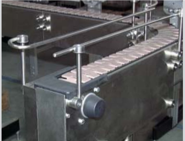
Utilizzo di SBF-P 2254 con copertura in acciaio inox per l'utilizzo nell'industria alimentare