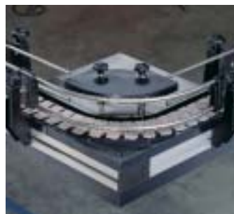
Curva 90° con guide regolabili