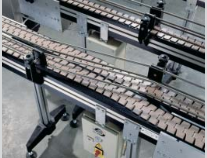
Segmento di trasferimento con guide laterali