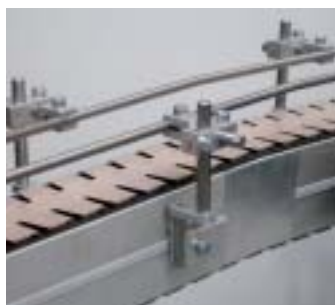
Breve inclinazione verticale per la formazione di un'area di accumulo su più livelli