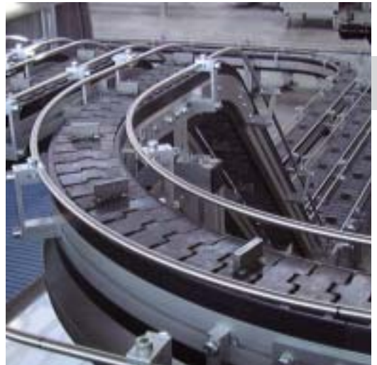
Catene a tapparella con inserti saldati