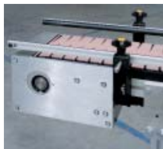
Testata con guide laterali