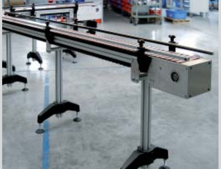
Testata e guide laterali SBF-P 2254