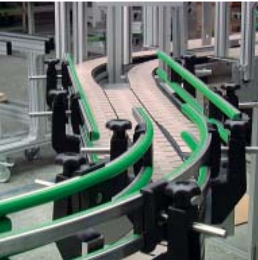
Segmenti di trasferimento da due lati