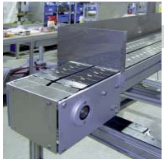
Trasportatori con catena a tapparella a due corsie