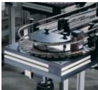
Curva di scorrimento con ruota 180° con guide laterali regolabili