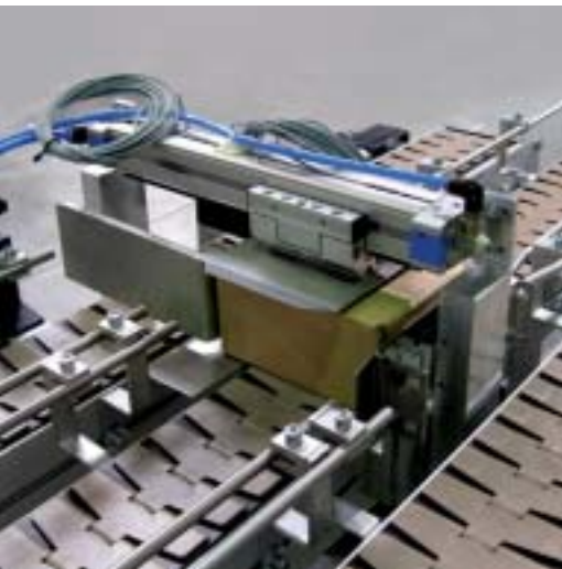
SBF-P 2254 con spintore di trasferimento, ad es. per il settore dell'imballaggio