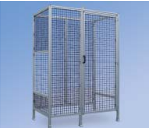
Protezioni perimetrali con pannellatura reticolata