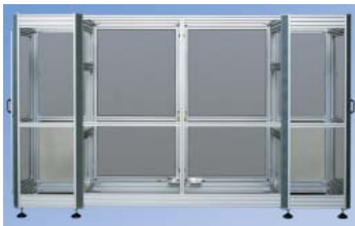
Protezioni perimetrali personalizzata per segmenti di trasportatore