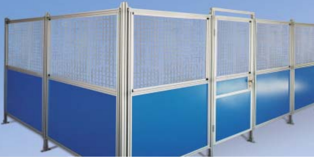
Protezioni perimetrali standard (metodo con montanti)