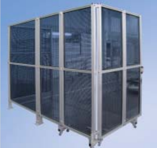
Protezioni su rotelle