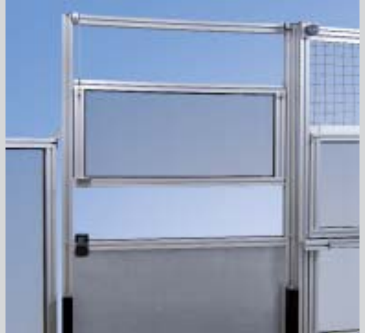
Elementi di porta verticale con contrappesi