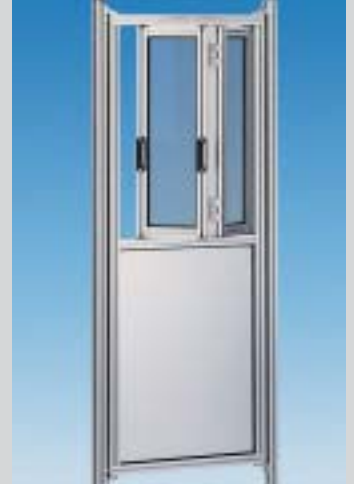
Porta a soffietto