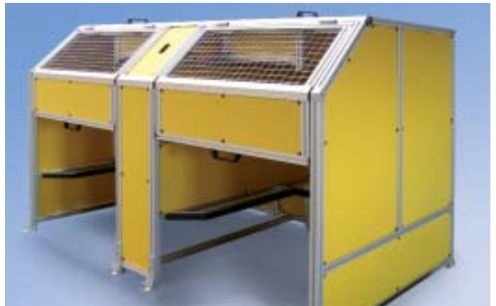
Protezioni perimetrali personalizzata con porte a battente verticali azionate con molle a gas