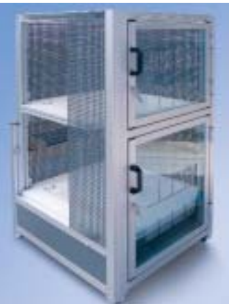
Protezioni perimetrali con pannelli di lamiera perforati in base alle specifiche richieste del cliente