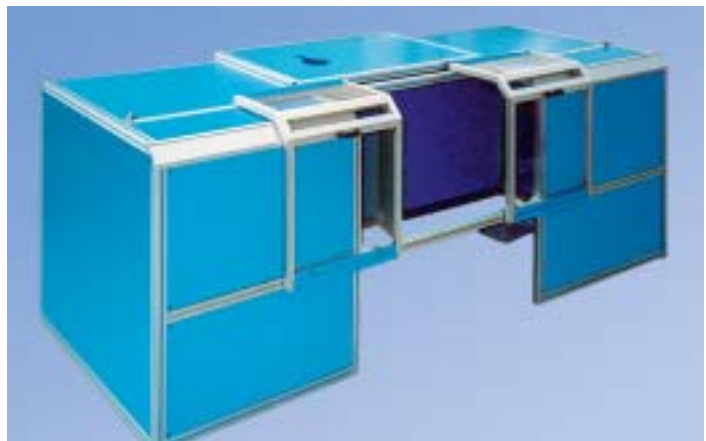
Protezioni perimetrali per macchinari di produzione