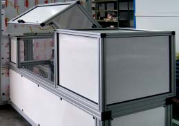
Protezioni perimetrali per macchinari con porta a battente verticale azionata con molle a gas