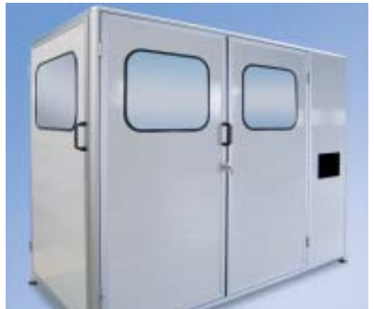
Cabina scanner con doppia porta a battente